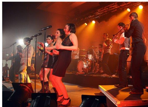
Le bal des variétistes -Bleu Pluriel - samedi 10 octobre